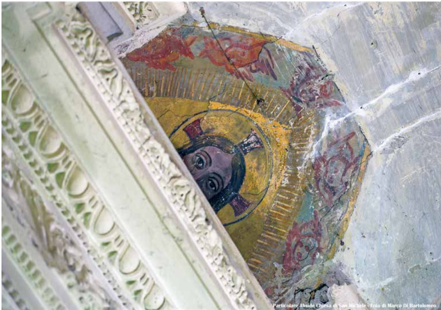
Particolare: Abside Chiesa di San Michele