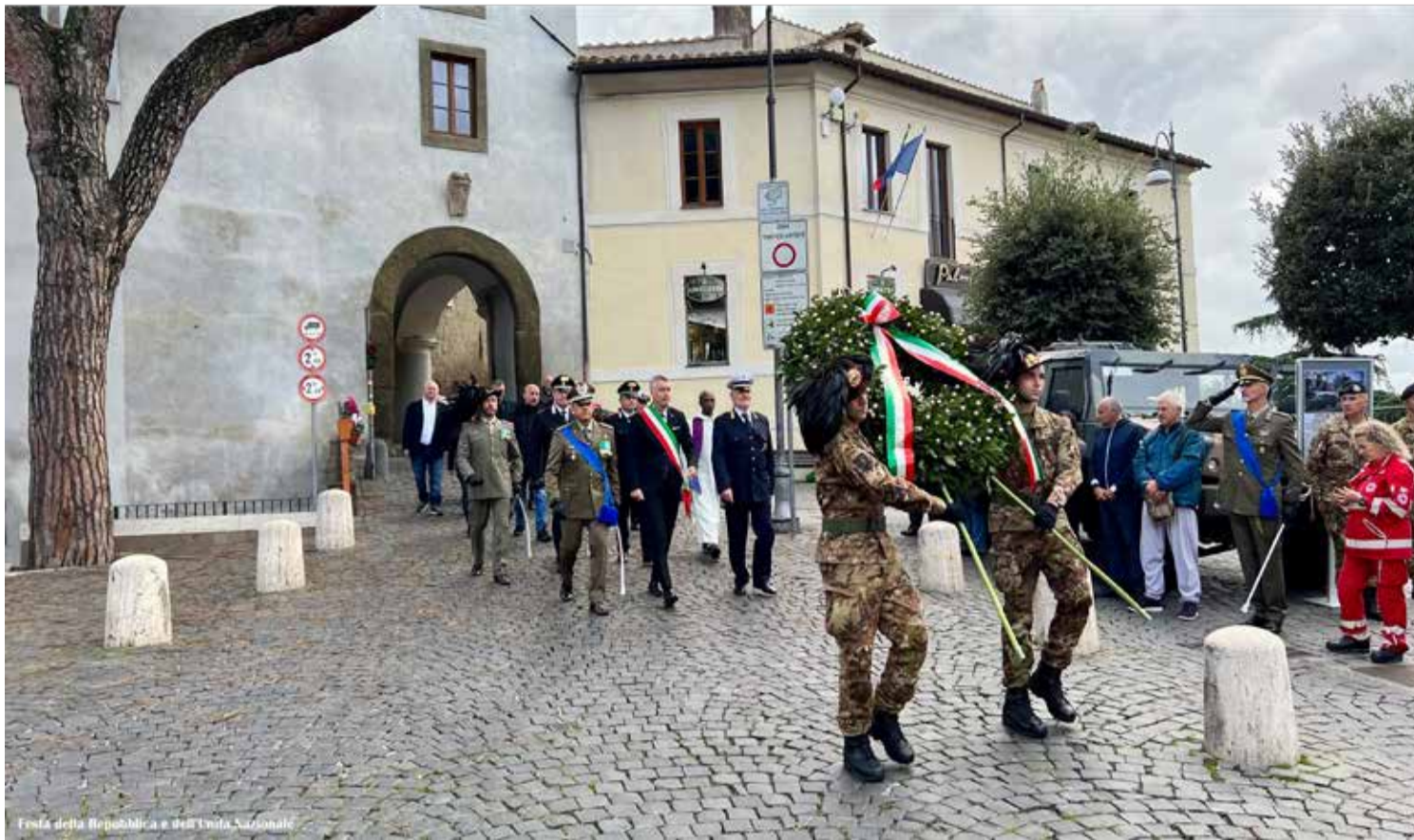
Festa della Repubblica e dell'Unità Nazionale