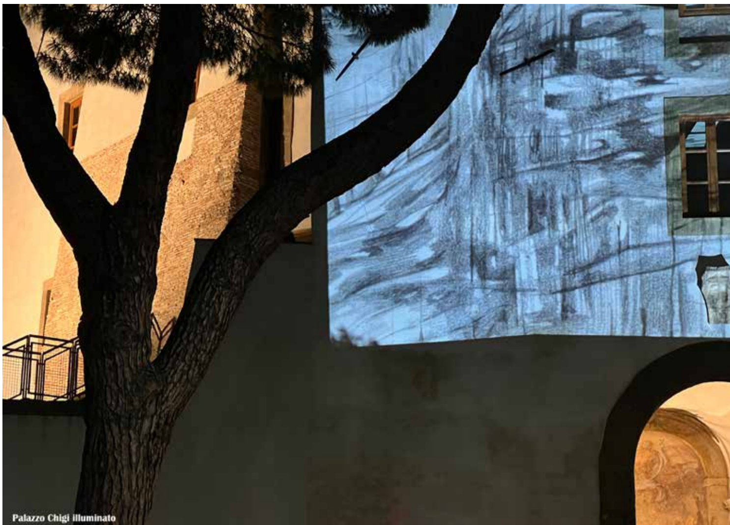
Palazzo Chigi illuminato