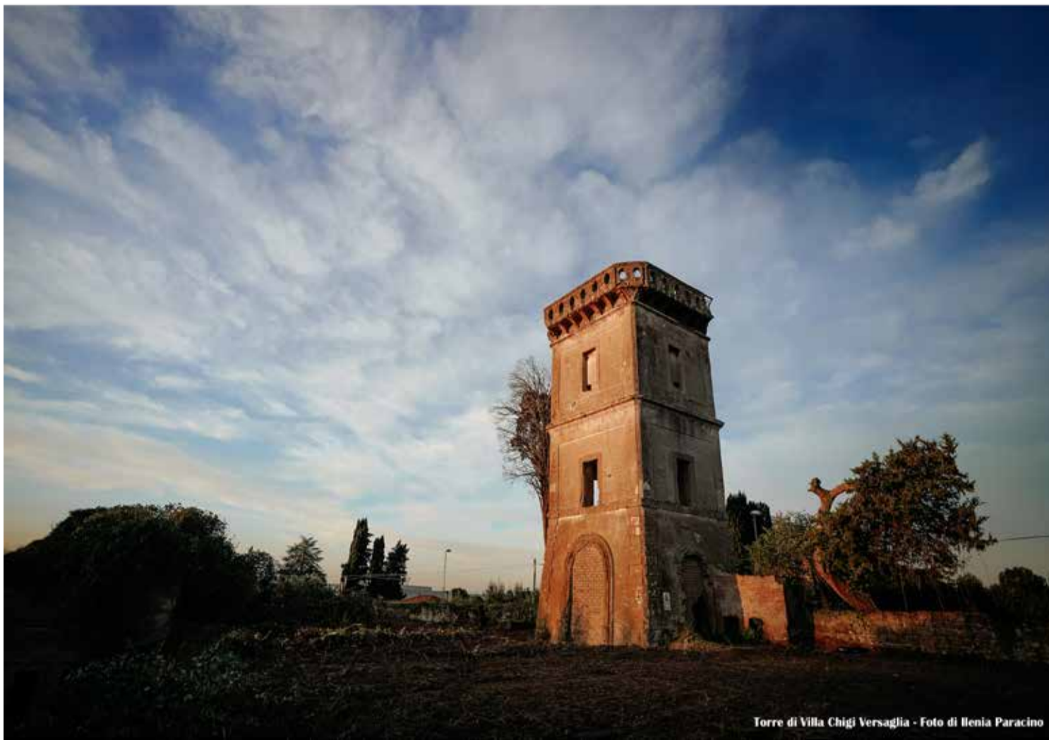
Torre di Villa Chigi Versaglia