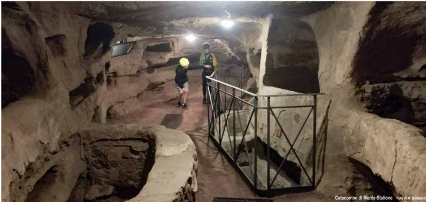
Catacombe di Monte Stallone