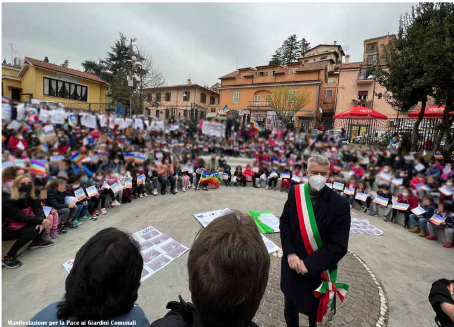
Manifestazione per la Pace ai Giardini Comunali